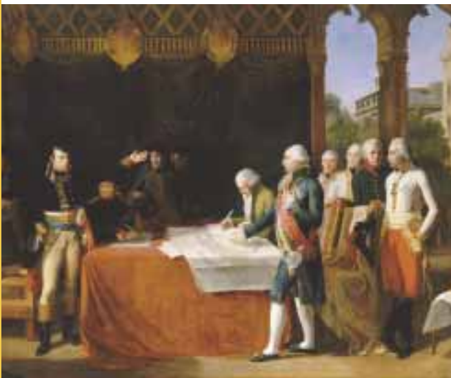
Signature des préliminaires de paix au château d'Ekward Lethière Guillaume Guillon