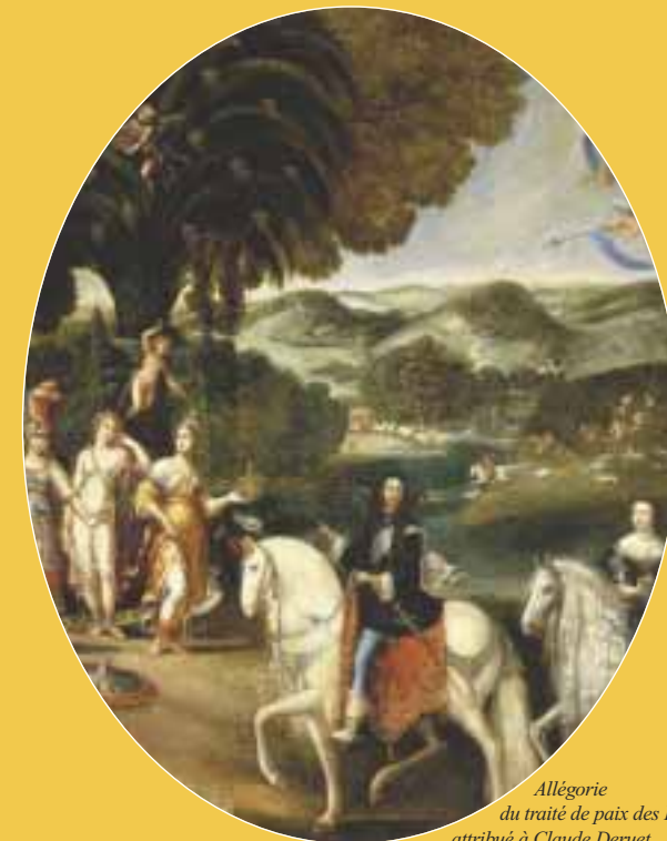
Allégorie du traité de paix des Pyrénées attribué à Claude Deruet

VENDREDI 31 JANVIER ET SAMEDI 1 ER FÉVRIER 2014 10H00 - 20H00 Centre Malesherbes - Sorbonne